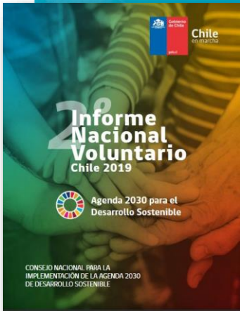
II Informe Nacional Voluntario