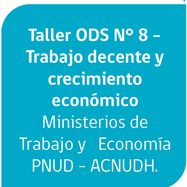
Taller ODS N° 8 – Trabajo decente y crecimiento económico Ministerios de Trabajo y Economía PNUD – ACNUDH.