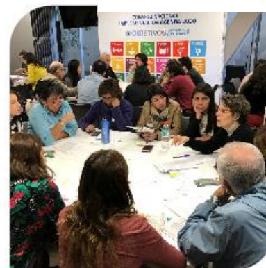
Taller ODS N° 16 – Paz, justicia e instituciones sólidas Ministerio Secretaría General de la Presidencia ACNUDH – PNUD.