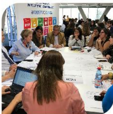
Taller ODS N° 4 – Educación de calidad Ministerio de Educación UNESCO – UNICEF.