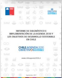
Informe de Diagnóstico e Implementación