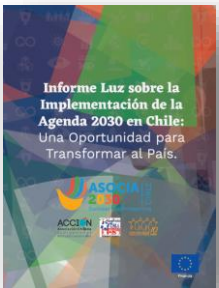
Informe Luz Asocia 2030 (sociedad civil)