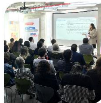
Taller ODS N° 13 – Acción por el clima Ministerio de Medio Ambiente FAO – PMA