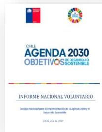
I Informe Nacional Voluntario (INV)