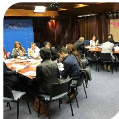
Taller ODS N° 10 – Reducción de las desigualdades Ministerio de Desarrollo Social y Familia PNUD – ACNUDH.